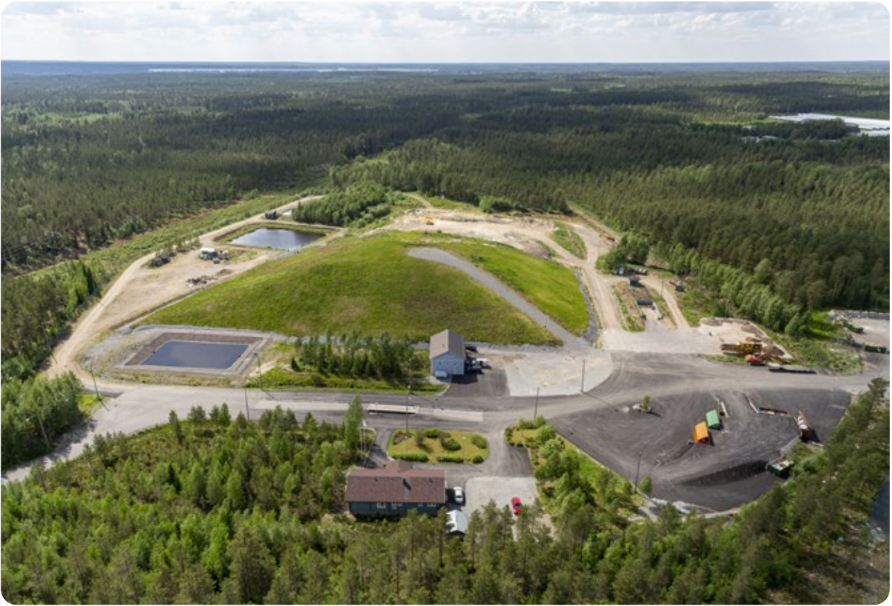
Millespakan jätekeskuksessa Alajärvellä käsiteltiin noin 3 000 kuormaa ja 6 455 tonnia erilaisia jätteitä.