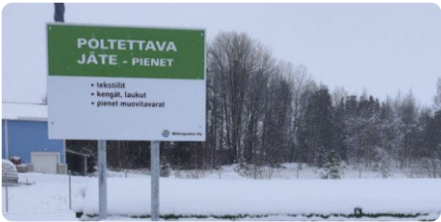
Keväällä 2023 aloitettiin Lappajärven uuden hyötyjäteaseman rakentaminen.