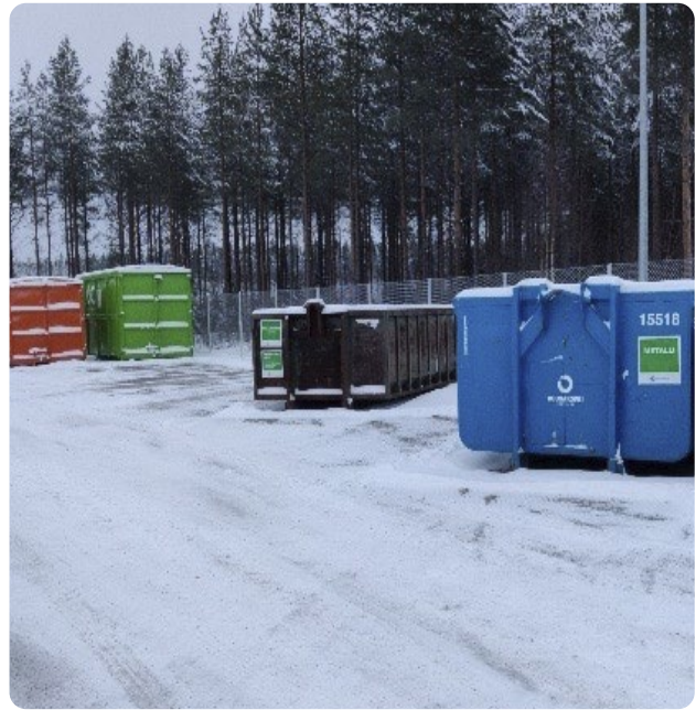
Soinin hyötyjäteaseman paikka vaihtui. Loppuvuodesta valmistui rakennusprojektin ensimmäinen vaihe.

Soinin hyötyjäteaseman yrittäjän vaihtuessa hyötyjäteaseman paikka vaihtui. Kesän aikana saatiin valmisteltua uusi, Soinin kunnan osoittama tontti ja päästiin rakentamaan uutta pohjaa. Aiemman yhteistyösopimuksen päätyttyä ja uuden palvelupisteen valmistuessa Soinissa jouduttiin selviämään jonkin aikaa ilman omaa hyötykäyttöasemaa. Vuoden loppupuolella hyötyjäteasemal palvelua voitiin jatkaa rakennusprojektin ensimmäisen vaiheen valmistuttua uudessa osoitteessa.